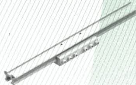
Fig. 22: raccordo per collegamento binari, tipo VB-13