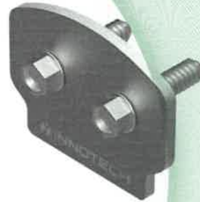
Fig. 17: elemento terminale chiudi-binario tipo TAURUS-EA-10