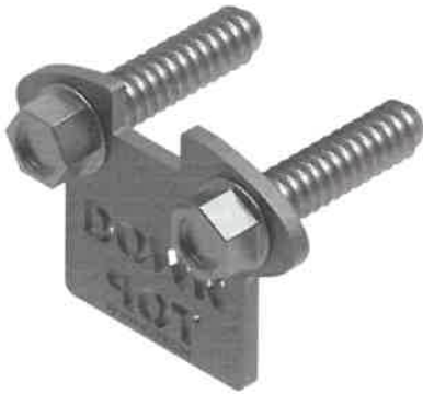
Fig. 18: elemento terminale chiudi-binario tipo TAURUS-EA-12