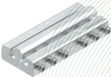
Fig. 19: raccordo per collegamento binari, tipo VB-10