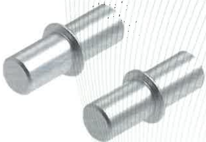
Fig. 21: raccordo per collegamento binari, tipo VB-12