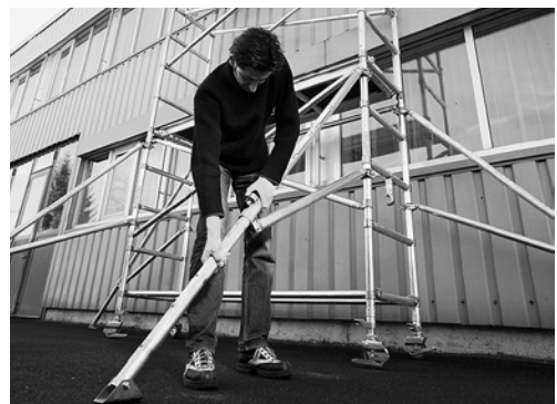
3 Sicherung des Rollgerüsts gegen Kippen.