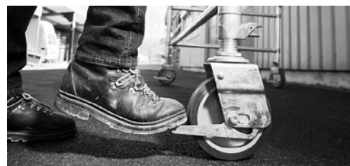
4 Vor dem Besteigen wird die Rollen-Bremse arretiert.

Es ist möglich, dass in Ihrem Betrieb noch weitere Gefahren zum Thema dieser Checkliste bestehen. Ist dies der Fall, treffen Sie die notwendigen zusätzlichen Massnahmen. Notieren Sie diese auf der letzten Seite.