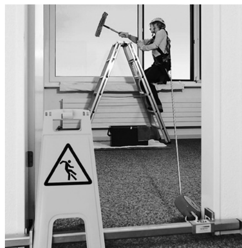
7 Die Person ist mit einem horizontal einsetzbaren Höhensicherungsgerät gesichert. Das Gerät ist an einer Traverse befestigt, die an einem sicheren Ort angeschlagen ist.