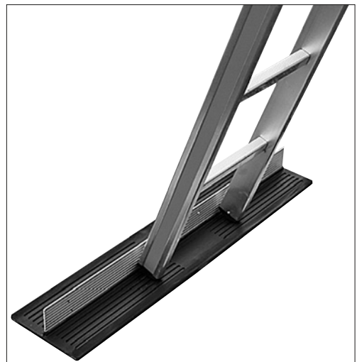
2 Durch eine geeignete Unterlage (z. B. Antirutschmatte etc.) wird das Wegrutschen des Leiterfusses verhindert.